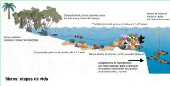
Figura 3; Tomado y modificado de: University of Maryland, Symbol and Image Libraries.

Cabe destacar, que cuando los meros se agrupan en la época de reproducción, es cuando la pesca excesiva de estas especies se facilita. Igualmente, la pesca es fácil, debido a la cercanía y visibilidad de estas especies, al estar asociadas con zonas poco profundas en las costas y arrecifes. Aunque se han observado las grandes agrupaciones para la reproducción, en la gran mayoría de especies de meros, hasta el momento este comportamiento no está bien documentado en el mero guasa.